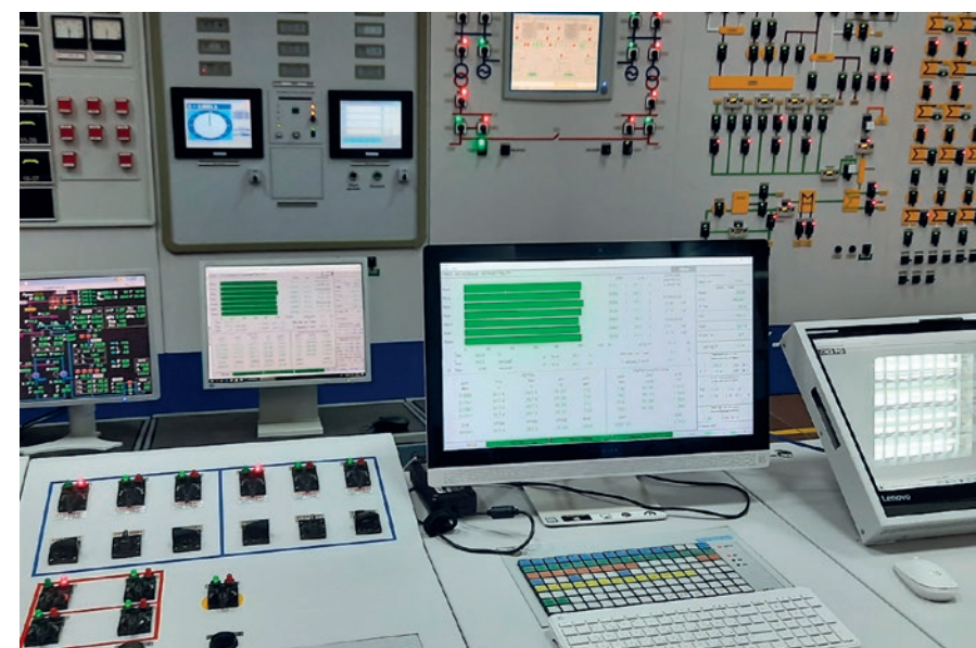
Сравнение на съществуващия СВРК „Круиз“ и новата разработка на компанията „Радий“ СВРК-Р-1000“

Системата GARDEL е удобна за оператора, тъй като непрекъснато сравнява изчисленията и измерени стойности на топлинната енергия на ядрото и показанията от сензорите в реактора. Тези проверки осигуряват незабавно валидиране на основния модел и увереност във възможностите на системата GARDEL. Надеждните методи и самоактуализацията се основен модел осигуряват много по-голяма точност от традиционните предварително изчислени таблични модели, които обикновено се използват за наблюдение, проследяване и поддържане на активната зона в периода на експлоатация. Във всеки момент от работния цикъл инженерите могат да